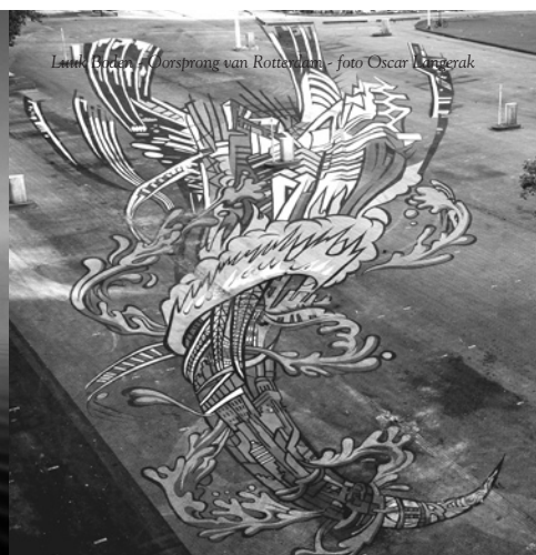
Lambertus - Oorsprong van Rotterdam